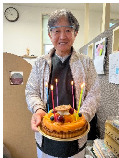
スタッフがお祝いしてくれました