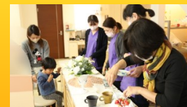
11月スタッフの誕生日

日本は初戦から非常に高いパフォーマンスで、強豪国から勝ちをもぎ取っていった。ドイツに2-1勝ち、コスタリカに0-1で負けたものの、なんとスペインに2-1で勝ち、死のグループと言われたグループEを1位で通過するという予想以上の活躍を