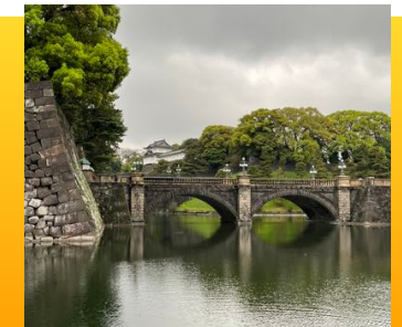
皇居二重橋 曇り空に涼として気高く、澄み渡った空気に心洗われました。

最新の治療を知るため、良い治療を患者さんに提供し続けるために例年東京に勉強に行っています。コロナ禍の2年間は東京は自粛していましたが、先日非常に良い治療を提供している歯科医院を見学してきました。おかげさまでにし歯科医院は開成の歯科医院として可愛がっていただいていますので、コロナが収束が期待される今、改めて患者の皆さんに良い治療を提供して、喜んでいただきたいと考えています。皇居のお堀をプラタモリして、私は心に誓ったのでした。