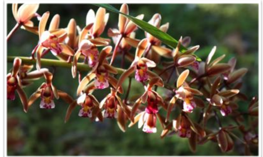
シンビジウムに比べると地味。しかしかわいい