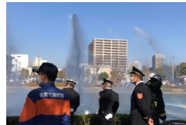
県図書館から見た放水の様子

1月8日(日) 佐賀城公演の北堀で恒例の「五色放水」も行われ佐賀城公園北堀に入った団員たちから一斉に放水された。放水の綺麗な映像を今までも報道されているのを見たことはありましたが、実際に現場で見て、写真を撮ったのは初めてのことでした。なかなか美しく派手なイベントのように私も捉えていましたが、そもその消防団出初めの意味を考えれば、見ている私も気が引き締まる思いもしました。このポンプによる一斉放水に先立って、兵庫北の佐賀市民運動広場では、市内全域12支団の消防団員約1750人が参加し、自主防火や防災への意識を新たにしたい。団員の皆さんの日頃の訓練に私たちは感謝し、佐賀市の安心安全を意識して生活していくことが大事なのだろうと、真面目に感じた新春の恒例行事でした。