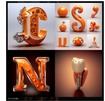
「にし歯科医院のロゴマークを考えて!」