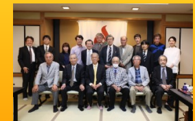
千代田館での開催も久しぶりでした。

コロナ禍のこの3年間は不慣れた時間でした。私はその中であつてもあまり恐れすぎることのないように、できるだけ日常通りの生活を送りたいと心がけてきましたが、それでもコロナにかかりたくない、人に移したくないという気持ちは強く心がけていましたから、5類相当と変更されて本当に嬉しく思っています。さて、4年ぶりに佐賀市の同窓会を開催できました。先輩方も元気で、久しぶりに顔を見てお話しすることができて、本当に良かったと思います。さあ、これからも更に元気にやっていきましょう!!