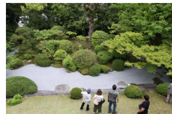
二階の和室から庭園を望んだところ