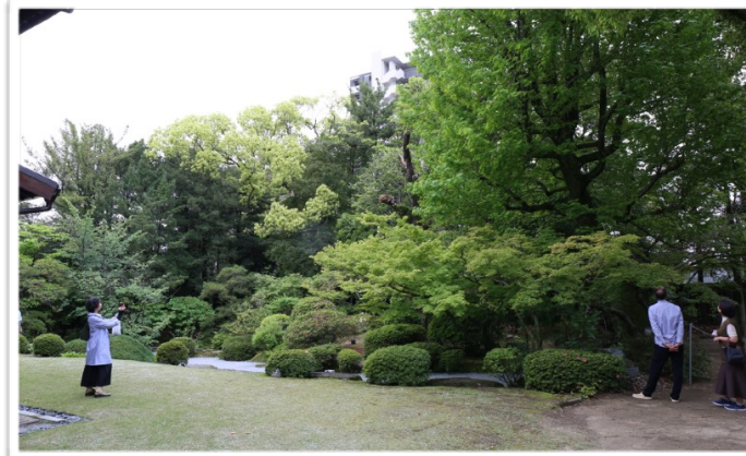
旧知事公舎の一般公開 よく手入れされた日本庭園