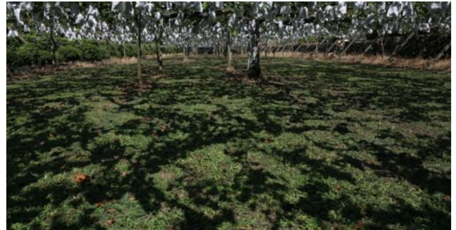
毎年名主丸のぶどう園に行っています。今年はちょっと早めで藤稔も巨峰も選ぶことができました。