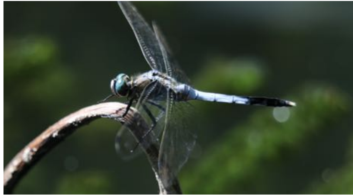
トンボの写真も上手に撮りたいと思いますが、また来年。