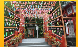
涼しげな音色で神社内は夏の装い

写真クラブの方から祐徳稲荷神社の参道に風鈴が連ねて飾ってあることを教えてもらいました。約1000個の風鈴は巫女さんが書いたものらしいです。すごいですねえ。全国的にもこのように風鈴を飾るところはいくつかあるようですね。祐徳稲荷の風鈴を皆さんも楽しんでみてください。写真ではこのような感じですが、音がありますから、私も動画でも撮りました。動画はYouTubeでも見ることはできますよ。