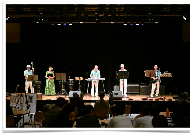
2024年11月23日（日）佐賀市エスプラッツホールで開催されました。中央スチールギターがH高様