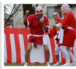
翌週の北川副桜まつりは快晴でした

さが桜マラソンがハーフマラソンから、フルマラソンになって今年で9年になりますが、今年初めて参加しませんでした。練習不足で完走に自信がなかったためですが、仲間のランナーたちを写真に収めて、最高の1枚を撮ってあげたいとの思いもあつての欠場です。しかし、当日はあいにくの雨の中での開催で、ランナー達にとっても大変でしたが、カメラマンにとっても非常に条件が悪く苦労しました。慣れていないせいで、どのコースポイントに行ってもランナーたちをうまく撮影する事ができませんでした。この様な事なら走った方が、楽で、達成感も感じられるかなあ。2025年は十分に練習を積んで走って参加しようと思います。