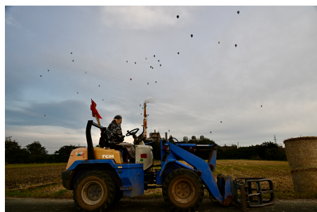
王子マテリア佐賀工場の奥の畑で作業中のおじさんもバルーンでひと息

10月29日（水）から11月3日（月祝）までの期間に例年の佐賀のお祭りが開催された。今年は私の友人を佐賀に招く予定でしたが、諸々事情ありそれは叶いませんでしたが、大会には連日通い詰めて写真を撮ろうと頑張りました。しかし、作品は出来ませんでした。今年も気持ちの良い秋の1日を過ごすことはできました。やはり佐賀にとってこのバルーンはとっても大事な行事だと感じました。おじさん作業中のこの牧草ロールは飼料用ではないそうですね。^^