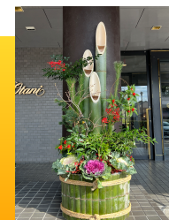
ホテル入り口の門松も立派でした

午前中に院内の大掃除をして、ホテルニューオータニ佐賀での楽しい食事会です。1年の反省と新しい年にしたいことが話題になりました。スタッフたちからもいくつか要望もありましたので、それに対応して、みんなでもた頑張りていきましょう。当日は気持ちの良い快晴で、窓越しに見る佐賀城西の堀端もとても気持ちの晴れる美しい風景でした。